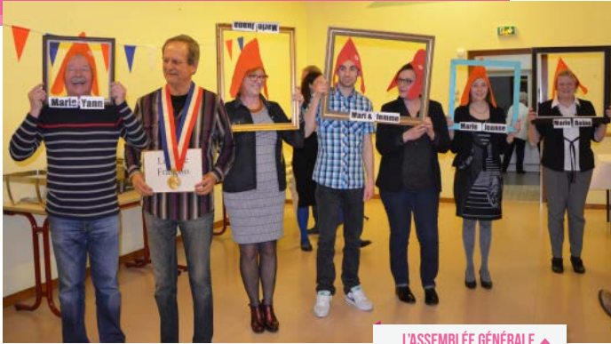
L'ASSEMBLÉE GÉNÉRALE ▲