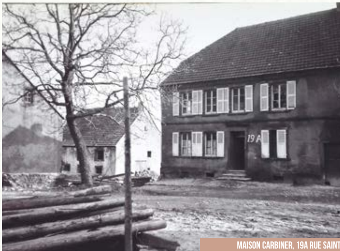
MAISON CARBINER, 19A RUE SAINT-MICHEL, EN CONTRE-BAS DE LA FONTAINE, AUJOURD'HUI DISPARUE ▲