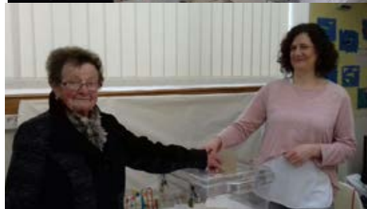
Les doyens de Cadenbronn accomplissant leur devoir civique lors des élections de 2017