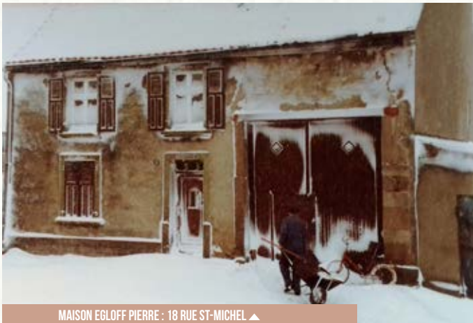
MAISON EGLOFF PIERRE : 18 RUE ST-MICHEL ▲