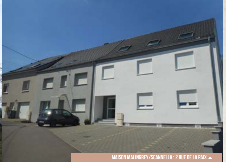
MAISON MALINGREY/SCANNELLA : 2 RUE DE LA PAIX ▲