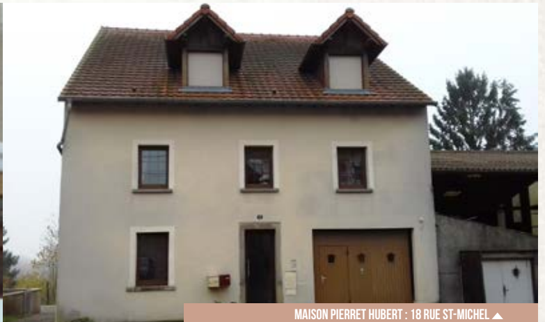
MAISON PIERRET HUBERT : 18 RUE ST-MICHEL ▲