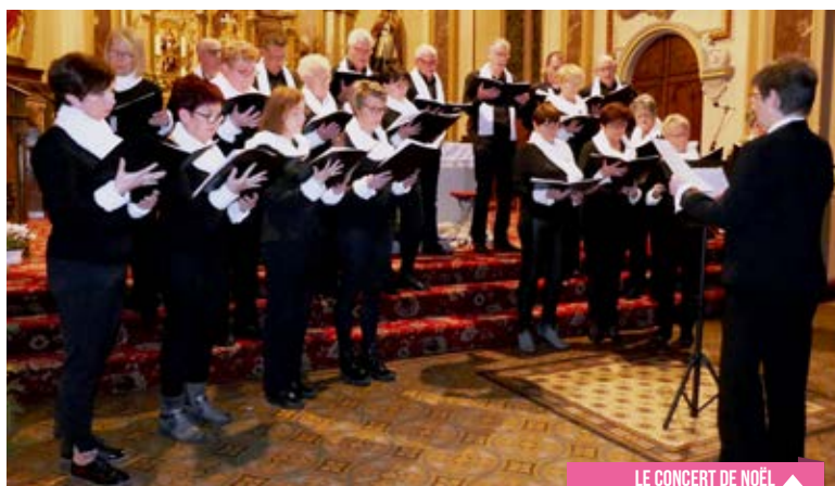
LE CONCERT DE NOËL ▲