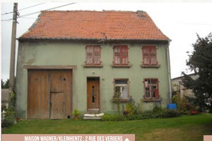
MAISON WAGNER/KLEINHENTZ : 2 RUE DES VERGERS ▲