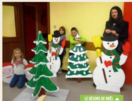
LE DÉCORS DE NOËL ▲