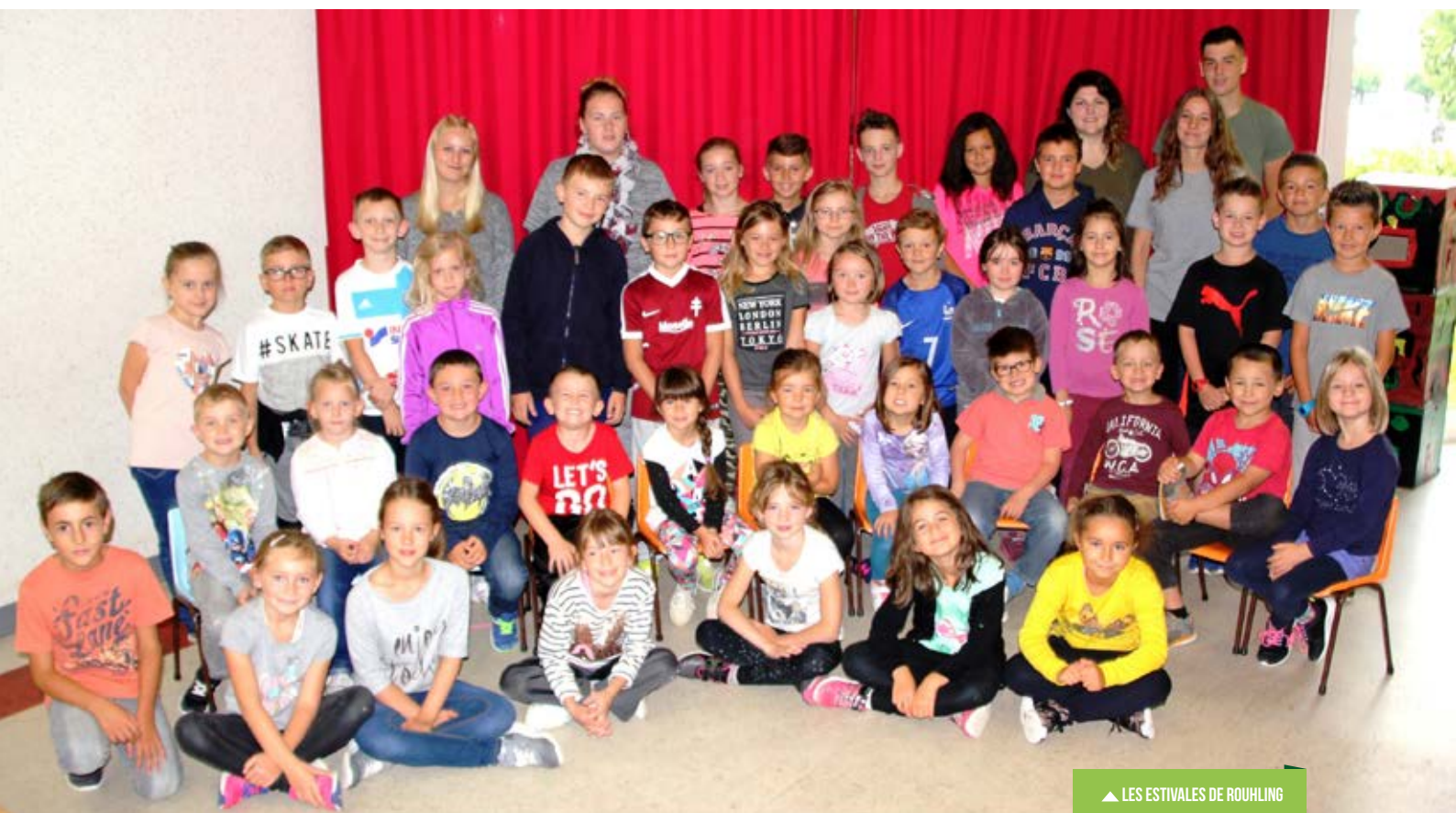
▲ LES ESTIVALES DE ROUHLING

Le montant de la participation communale pour l'année 2017, est de 4 982,00 €.