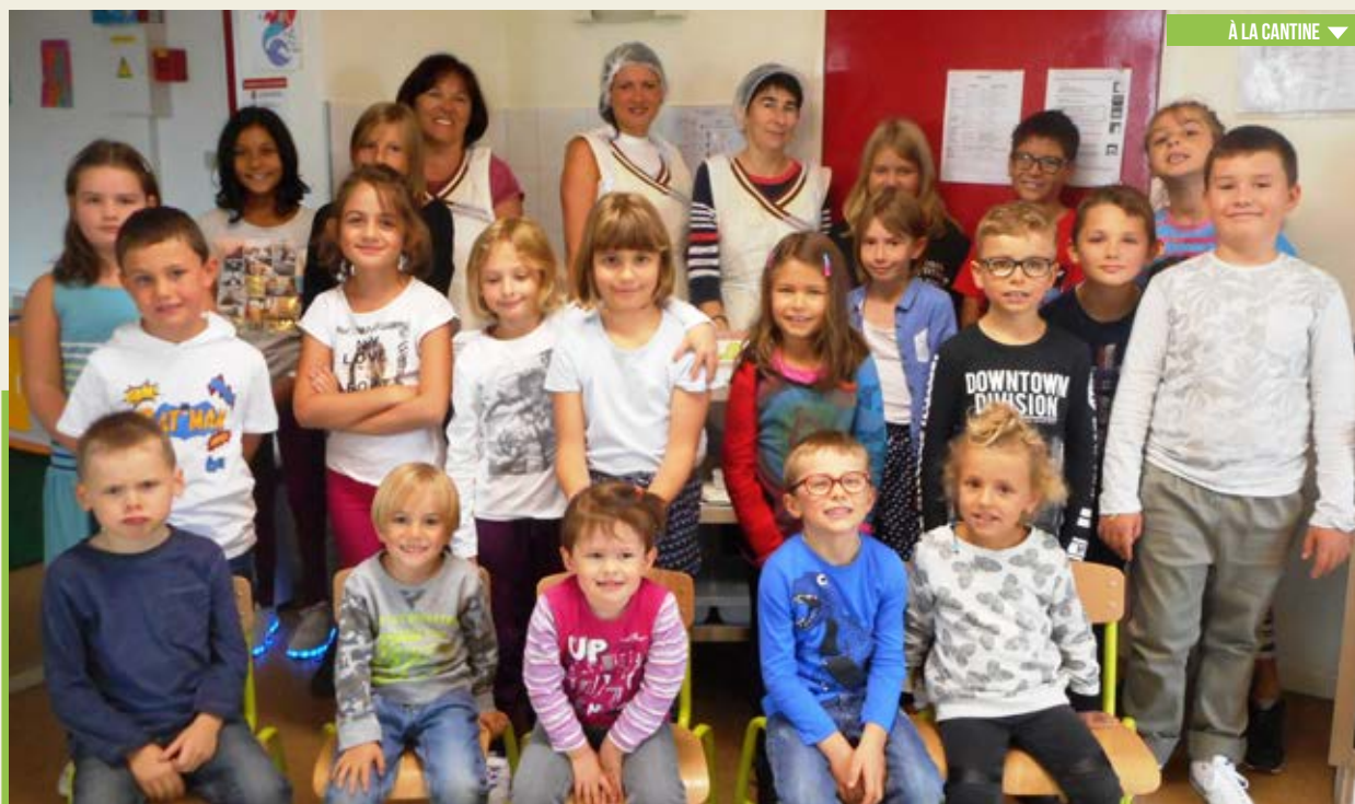
À LA CANTINE ▼

Les salaires du personnel représentent les 2/3 des dépenses de fonctionnement.