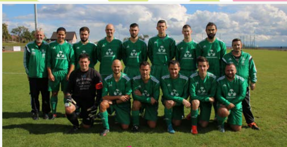
L'ÉQUIPE C ▲