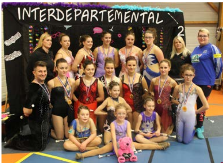
▲ LES TWIRLERS INDIVIDUELS