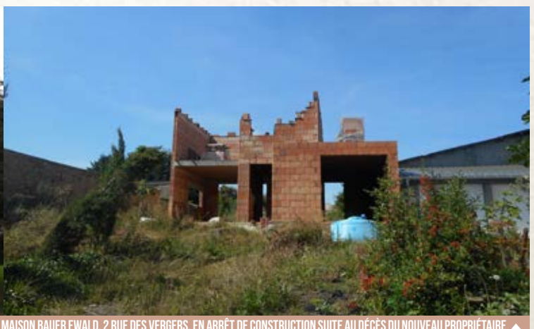
MAISON BAUER EWALD, 2 RUE DES VERGERS, EN ARRÊT DE CONSTRUCTION SUITE AU DÉCÈS DU NOUVEAU PROPRIÉTAIRE ▲