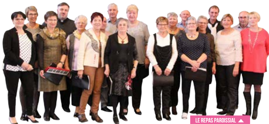
LE REPAS PAROISSIAL ▲