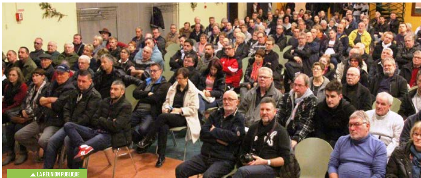
▲ LA RÉUNION PUBLIQUE

La page TV Grauberg de notre bulletin vous fournira tous les renseignements nécessaires à votre adhésion à la nouvelle Régie Fibraggio.