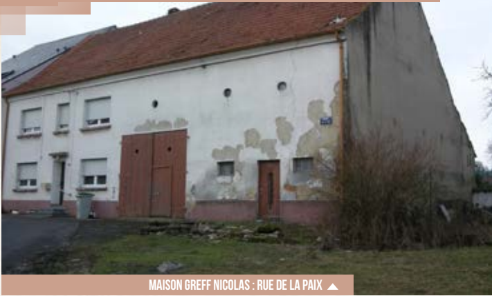
MAISON GREFF NICOLAS : RUE DE LA PAIX ▲