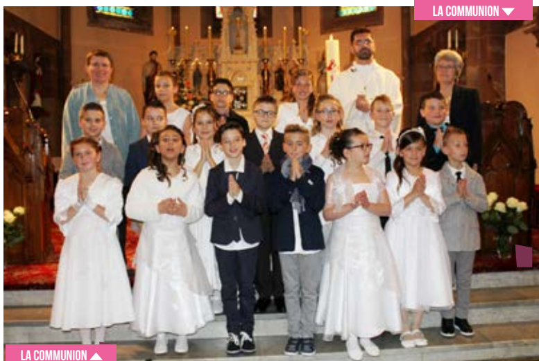
LA COMMUNION ▲

■ DIMANCHE 17 DÉCEMBRE , à l'église St Nabor de Nousseviller, concert de Noël par notre chorale « Les 3 petites not's » suivi d'un moment de convivialité offert par le conseil de fabrique et l'USCNC.