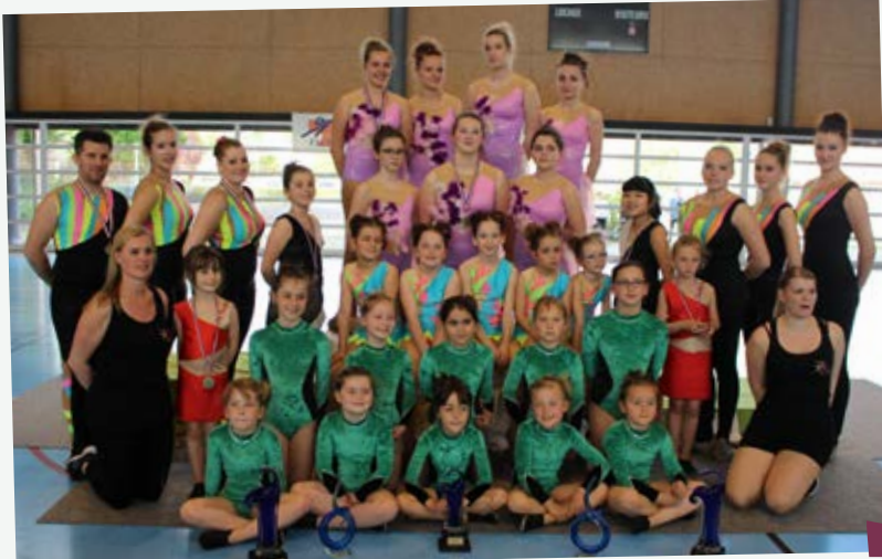
▲ LE GROUPE DES TWIRLERS

Les twirlers et leurs entraîneurs ont ensuite préparé le spectacle « Le Monde Magique de Nous' », présenté le samedi soir de « Nous' fête l'Eté ». Les participants ont été heureux d'emmener le public, venu nombreux, dans un monde merveilleux, à la rencontre des contes, des héros et des princesses.