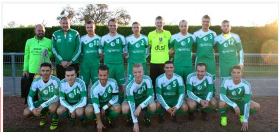
L'ÉQUIPE A ▲