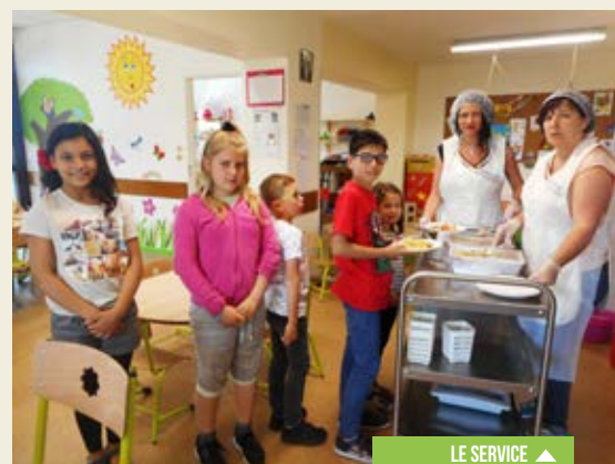
LE SERVICE ▲

Pour la municipalité, le bilan financier de ce service s'établit comme suit :