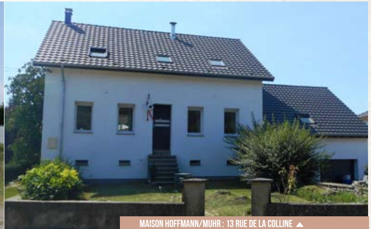
MAISON HOFFMANN/MUHR : 13 RUE DE LA COLLINE ▲