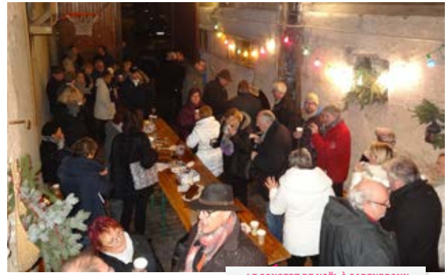
LE CONCERT DE NOËL À CADENBRONN ▲