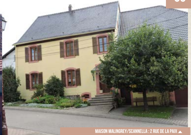
MAISON MALINGREY/SCANNELLA : 2 RUE DE LA PAIX ▲