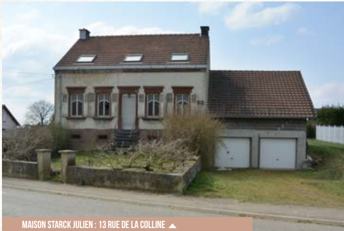
MAISON STARCK JULIEN : 13 RUE DE LA COLLINE ▲