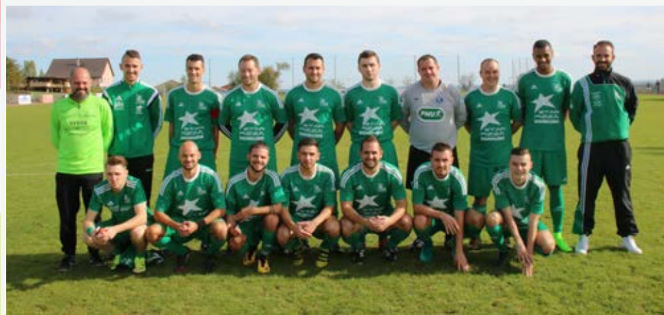
L'ÉQUIPE B ▲